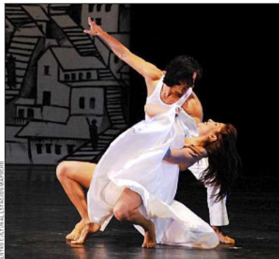
CENTRO CULTURAL ESTACIÓN MAPOCHO Ubicado en la Estación Mapocho, difunde diversas actividades, como expresiones artísticas y culturales. Recibe casi un millón de visitas al año; además, es un punto de encuentro de ferias, congresos y conferencias.