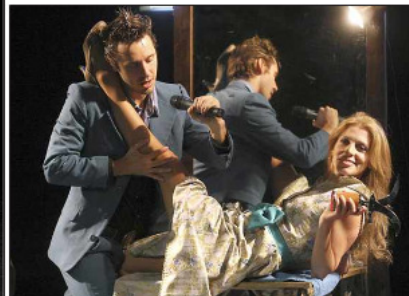
CENTRO MORI Se define como una empresa integral de cultura, entretenimiento y desarrollo de contenidos. Ellos buscan generar un nuevo modelo de desarrollo cultural para Chile.