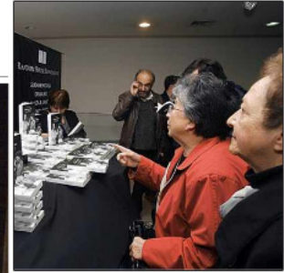
CENTRO CULTURAL PALACIO LA MONEDA Está bajo la Plaza de la Ciudadanía, y fomenta la creación y la difusión del patrimonio visual y audiovisual nacional e internacional.